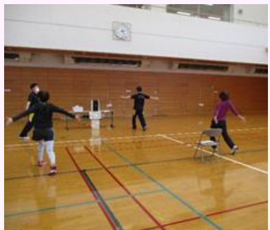
フレイル予防講座の開催 ( (社福) とちぎ健康福祉協会)