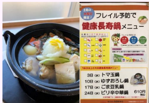
啓発メニューの提供 (栃木県生協食堂)