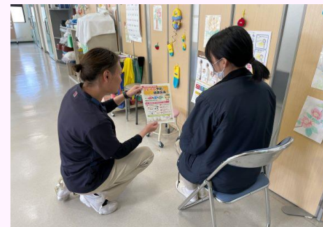
施設利用者への配布 (一社) 栃木県作業療法士会