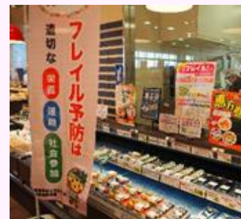
販売店店頭での啓発 (株)とりせん