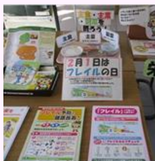
展示コーナーの設置 (安足健康福祉センター)