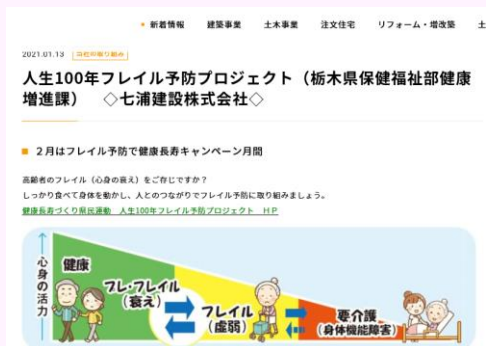
会社ホームページへの掲載 (七浦建設(株))