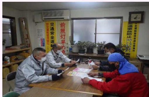
社員へのチラシ配布 (株)中家組