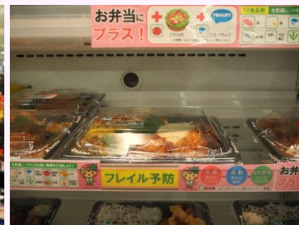
販売店店頭での啓発 (株)ファミリーマート