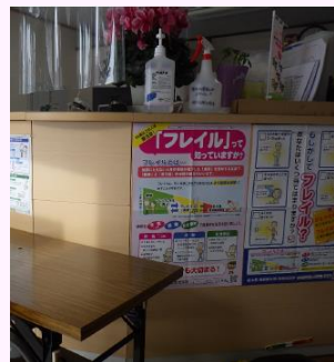
社内での掲示 (株)阿部工務店