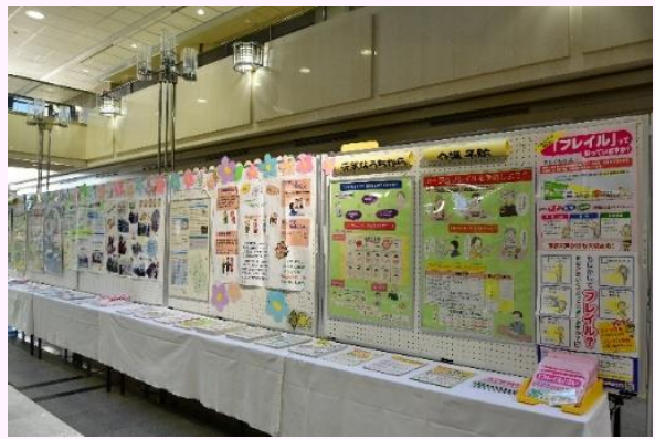
展示コーナーの設置 (宇都宮市)