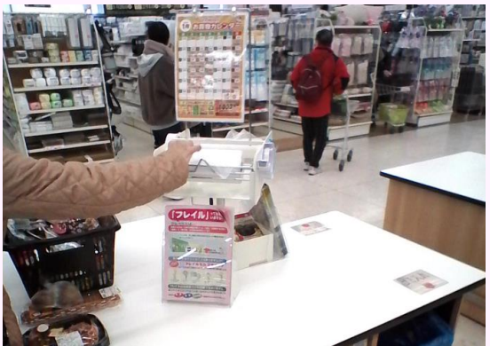
販売店店頭での啓発 (株)とりせん