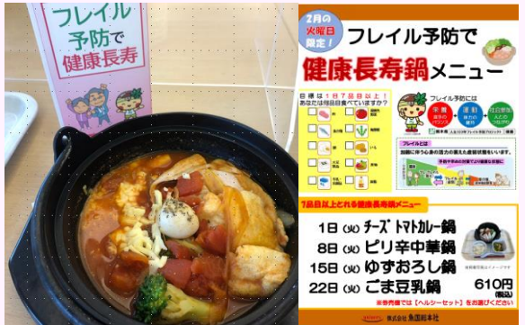
啓発メニューの提供 (栃木県生協食堂)