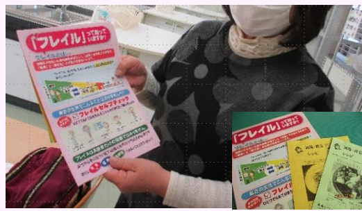
地域住民への資料配付 (栃木市食生活改善推進員協議会)