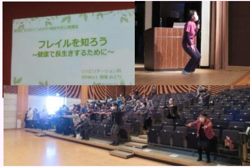
市民公開講座 (JCHOうつのみや病院)