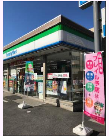
販売店店頭での啓発 (株)ファミリーマート