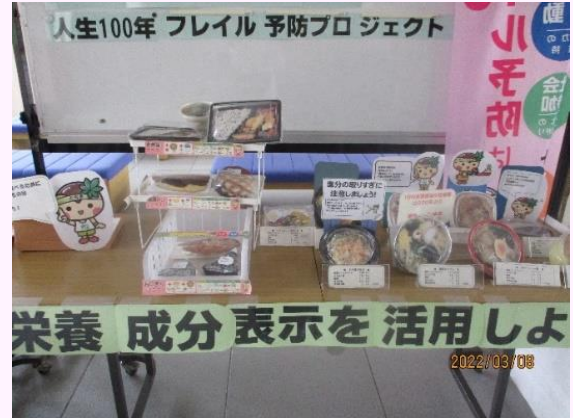
展示コーナーの設置 (安足健康福祉センター)