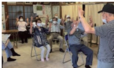
シルバーサポーターによる脳トレ体操