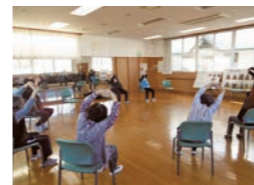
ストレッチの実施