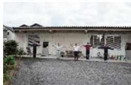
職場でのラジオ体操の実施