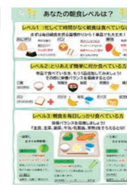
栄養だよりの発行