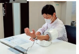
血圧計を設置し、健康状態を把握