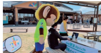
道の駅における健康増進イベントの実施