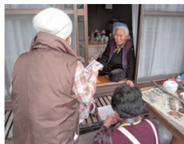
ひとり暮らしの高齢者を訪問