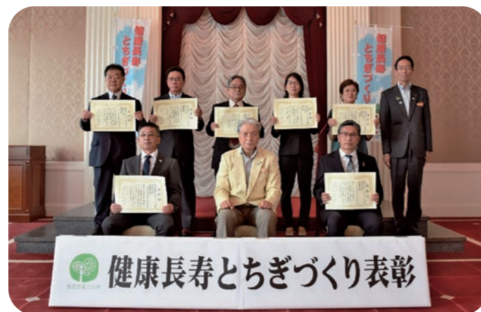
最優秀賞及び優秀賞 受賞事業所・団体

令和3(2021)年10月5日(火)に栃木県庁昭和館正庁において表彰式を行い、最優秀賞及び優秀賞を受賞した事業所・団体の皆様に表彰状が授与されました。