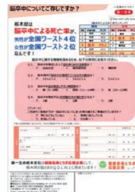
脳卒中に関するリーフレット