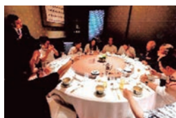
懇親会の開催(コロナ禍前)