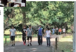
ウォーキングイベントの実施