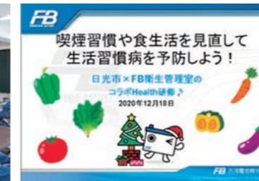
日光市と連携した取組