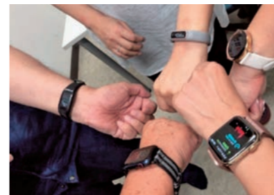
ともに励ましあい、運動機会を増やす従業員