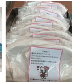
手作りマスクの配布