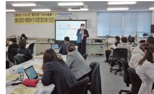
社内研修会の開催