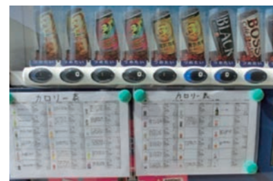
自動販売機にカロリー表を掲示