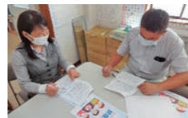
社内での研修の実施