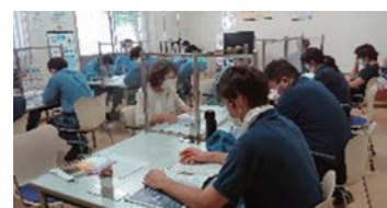
社内勉強会の様子