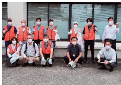
健康チャレンジ月間としてウォーキングラリーを実施