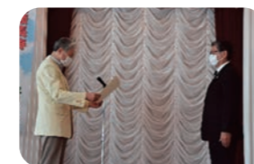
健康応援部門最優秀賞 第一生命保険株式会社栃木支社