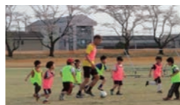
サッカー体験授業の実施