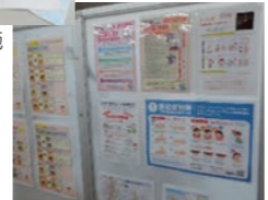
リーフレット掲示による啓発