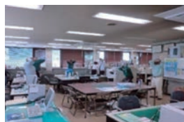
朝礼時に ストレッチを実施