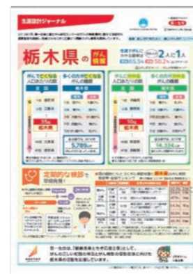
がんに関するリーフレット