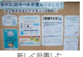
新しく設置した健康掲示板を通じた啓発