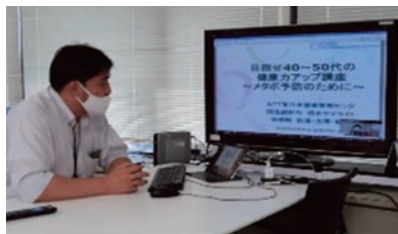
メタボリックシンドローム予防講習会の開催