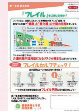
フレイルに関するリーフレット