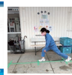
ロコモ度のチェック