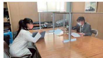
個別栄養指導の様子