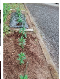
野菜の栽培・配布