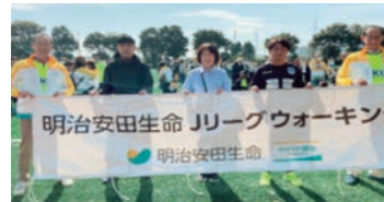
Jリーグウォーキングの実施