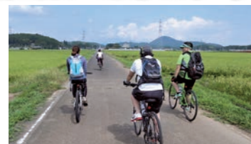
サイクリング部の活動風景