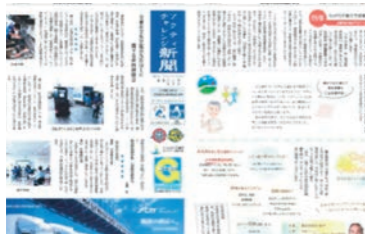
アクティチャレンジ新聞(社内新聞)で情報発信