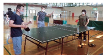
社内卓球大会の開催