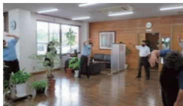
毎朝のラジオ体操の実施

株式会社 アクティチャレンジ 所在地:宇都宮市西川田6-6-21 TEL:028-680-6411