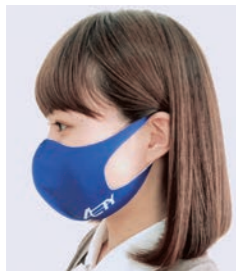
会社ロゴ入りマスク支給