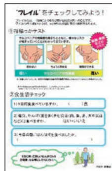
「フレイルをチェックしてみよう」の配布