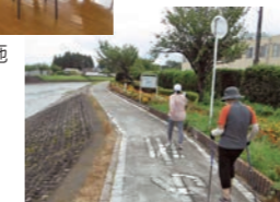
ノルディックウォーキングの様子