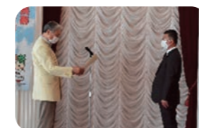
健康経営部門最優秀賞 古河電池株式会社今市事業所